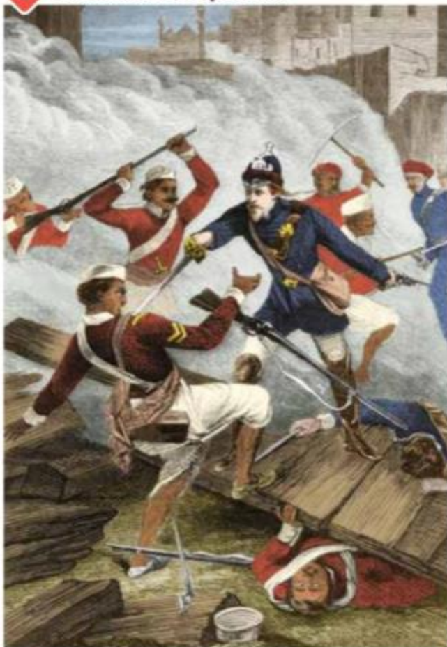
▲ Gravure colorisée, 1858.