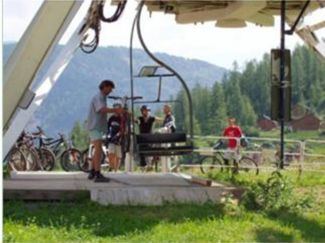
Usage de télésièges pour VTT – Roubion (Alpes Maritimes) au slogan évocateur : Roubion ... en toutes saisons

■ Philippe Bourdeau, « De l'après-ski à l'après-tourisme, une figure de transition pour les Alpes ? », Revue de géographie alpine , 2009.