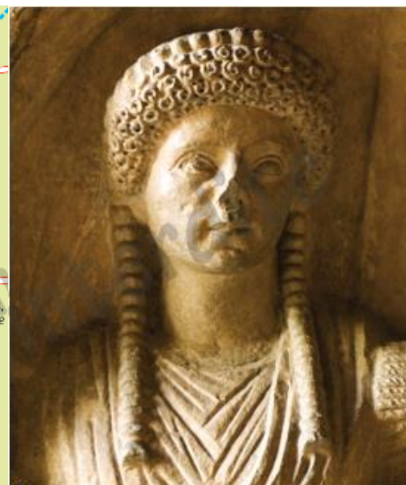
2 Lucinia Flavilla, une Nîmoise de haut rang

(Bas-relief en pierre, II e siècle après J.-C. Musée archéologique de Nîmes.)