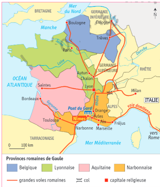
6 La Gaule romaine