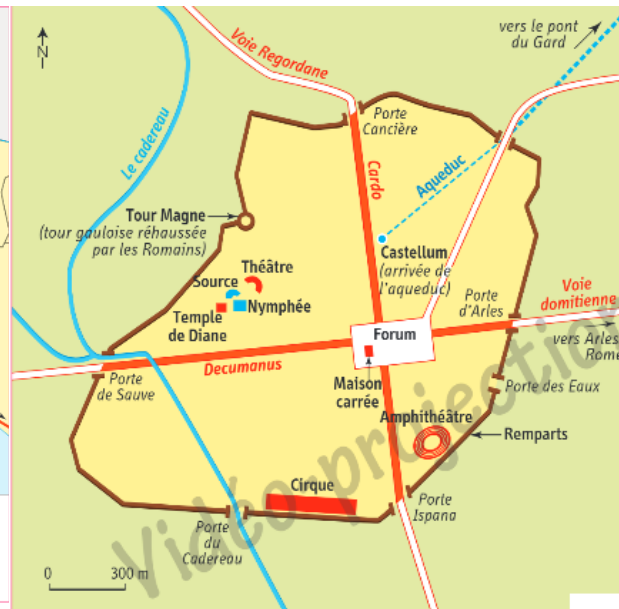
1 Nîmes à l'époque romaine