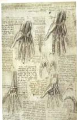
Planche d'anatomie dessinée par Léonard de Vinci. ▶

Léonard de Vinci, Traité de la peinture , 1651.