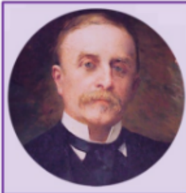
Henry Schneider (1840-1898)

« Pensez vous qu'il ne faut pas de l'argent pour faire marcher une "boîte" comme celle-ci ? A côté du directeur, il a le capitaliste qui apporte le capital. Ce capital qui alimente tous les jours les usines des outillages perfectionnés, le capital sans lequel rien n'est possible, qui nourrit l'ouvrier lui-même ! Ne représente-t-il donc pas une force qui doit avoir sa part de bénéfices ? Si vous supprimez au capital son intérêt, vous n'en trouverez plus quand vous en aurez besoin ! »