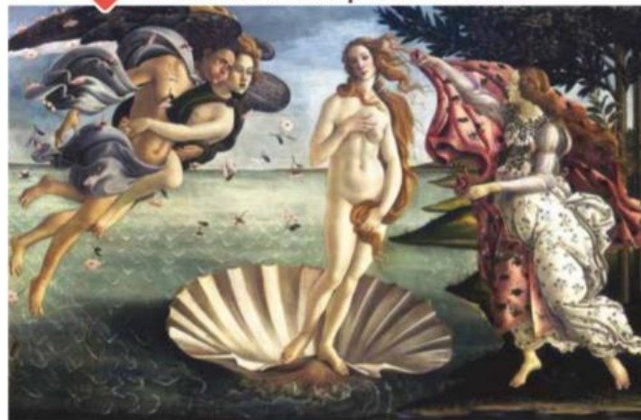
◀ Peinture sur toile, 172 x 278 cm, vers 1489 (Galerie des Offices, Florence).

Le sujet antique du tableau aurait été proposé par Laurent de Médicis, conseillé par les humanistes de la cour. La Vénus a pour modèle l'amie de Julien de Médicis, l'un des trois fils de Laurent de Médicis.